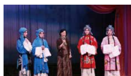
文: 艺术实践管理处

《锁麟囊》是程派艺术集大成之作，因其深刻的主题立意、巧妙的剧情结构、动听的唱腔旋律而世人推崇，成为京剧舞台上久演不衰的传统剧目；由南棗先生亲自执笔改编，中国戏曲学院二级教授、程派传人张火丁首演的京剧《江姐》是新中国成立以来第一部程派现代戏，二十年来唱响大江南北，剧中“红梅赞”“绣红旗”等唱段已成经典深入人心，流传于世。届时，研习班学员们将在对传统与现代的艺术诠释中再现经典，以此展现她们塑造角色、把握人物精神实质与时代气息的舞台功力。值得一提的是，两场演出的“四壁四柱”皆由国家大剧院三团演员出演，优秀青年演员以及中国戏曲学院优秀青年教师相携，尽管如今他们单位不同、身份各异，但却有一个相同而又响亮的名字——“国戏人”，他们是中国戏曲学院所培养的优秀戏曲人才，无论身处何地，号令一声，迅速成团，扶掖后进、甘当人梯，不仅彰显着戏曲人一脉相承的“传帮带”精神，更体现了新时代戏曲艺术工作者坚定的文化自信与使命担当。