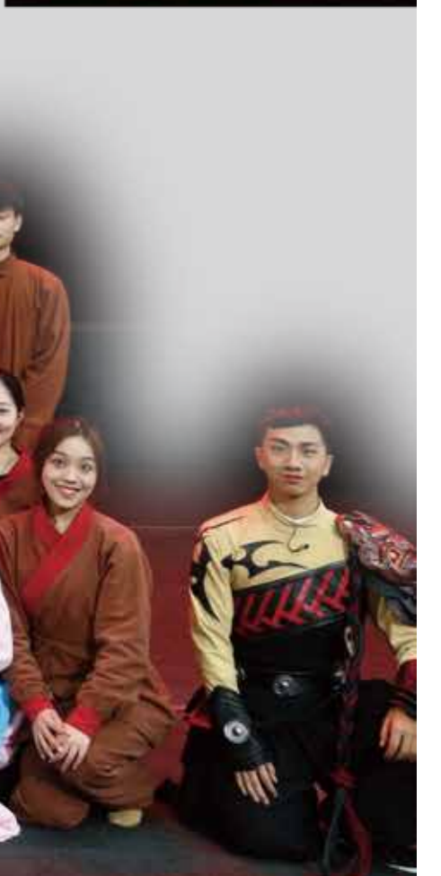
文: 国际文化交流系 图: 国际文化交流系

中国戏曲学院院长尹晓东在接受采访时提到，作为创作、表演、管理专业兼备，育人体系完整的戏曲教育高等学府，中国戏曲学院集合教学创作实践，能够在整合优势资源基础上对戏曲艺术人才培养、作品创作进行有价值、有意义的探索，这是学院原创剧目重要特色与亮点。艺术的真谛就是传递“真、善、美”，要把优秀的作品传向社会，带给人民。学院师生的艺术创作如何在薪火相传的过程中更好地服务于人民，是国戏人未来探索和必将践行的初心与使命。 《秋瑾》在音乐方面采用新创作模式，将京剧传统乐器与交响乐相结合，通过现代舞蹈语汇、舞台设计、人物造型营造现代气息，赋予革命题材以当代艺术审美。传统京剧艺术与现代艺术表现形式交融，传统京剧语汇与时代精神、思潮相呼应，是艺术高校对优秀传统文化进行创造性转化、创新性发展的生动实践。新型戏曲创作模式的使用，也是我院作为中国戏曲教育最高学府，对当代戏曲演出模式的一种探索与思考。 我院在教学实践和剧目原创层面始终坚持继承优良传统，包括建校后第一部师生联合创排的校戏《白蛇传》在内的很多剧目，一直流传至今并成经典。此次《秋瑾》的创作是新时代学院在探索师生跨系合作、推进艺术校实践、教学和科研共融机制建设的一次重要尝试。剧中的创作人员多由国戏的优秀青年教师和优秀学生担纲，通过“老带青”“师带生”“创、教、研”三位一体的方式，实现教师人才梯队建设、学生培养的三重效果，是学院“在教学中践行艺术真谛”的生动实践。 演出现场观众表示，《秋瑾》作为一部原创京剧现代戏，唱词优美动听，音乐设计与配器让人称道，舞美现代化适配度中美。演出过程与观众互动，结合现代艺术元素的融入，让观众“好戏好看，动人”。 张君秋先生之弟子、京剧表演艺术家宋玉珍老师在观看演出后对剧目在创新层面给予鼓励。他认为，国戏青年教师的表演值得肯定，师生同台的模式更体现了国戏的育人风貌，音乐、舞蹈以及新创作模式的使用都具有当代意识、先锋意识，希望国戏在剧目上进一步打磨，让《秋瑾》唱得更响、传得更远。 “秋风起兮云飞扬，逐逐残骸扫野荒。一番肃穆体天意，悲思未路诉凄凉。秋风起兮百草黄，秋风之性且且刚。能使群芳皆俯首，助她残菊傲风霜。”在合唱声中，原创京剧《秋瑾》二轮演出顺利落下帷幕。但鉴湖女侠的革命精神和敢为天下先的大义担当，将一直激励和鼓舞着全体国戏人。在贯彻落实习近平总书记给学院师生重要回信精神一周年之际，学院以《秋瑾》等剧目的创作表达对革命先烈的缅怀，以舞台搭建信仰，以实际行动展现国戏人在新时代、新征程“立德树人、守正创新、青春当努力、更努力”的信心与决心。