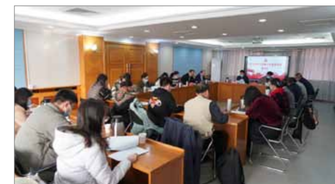
文: 思政部