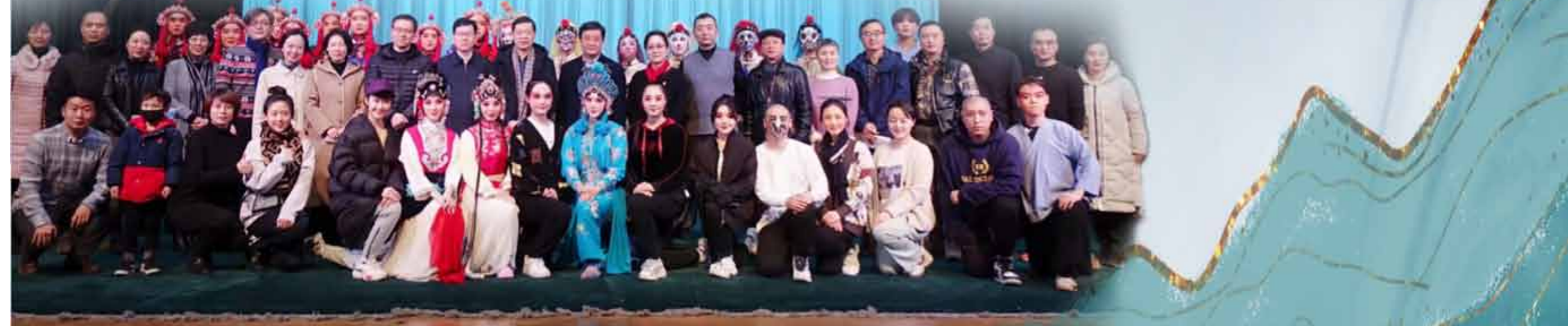
文: 京剧系 图: 京剧系